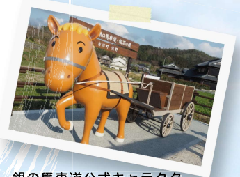
銀の馬車道公式キャラクター ハヤブ