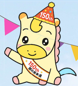
銀の馬車道公式キャラクター マドレーヌ