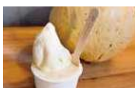
銀馬車かぼちゃの ジェラート