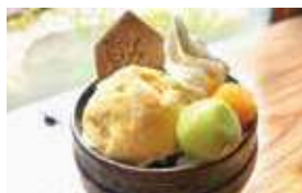
銀馬車かぼちゃの ミニパフェ