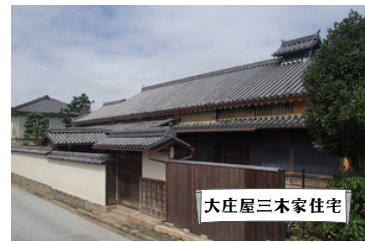
大庄屋三本家住宅