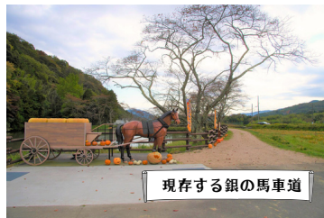
現存する銀の馬車道