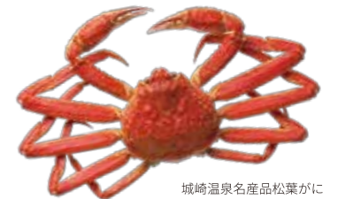
城崎温泉名産品松葉がに