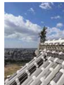
大天守からの眺望

姫路城は、慶長年間に建てられた日本に現存する最大の城郭建築であり、日本独自の技術が最高潮に達した時期の最も完成された城とされています。日本の城の魅力が凝縮されていると言われる姫路城は、連立式天守の大規模な構造美、本格的な螺旋式縄張りや筆頭に、黒田官兵衛が築いた石垣や、装飾性の高い花頭窓(かとうまど)など見どころが満載です。大天守からは、秀吉や官兵衛も見たであろう姫路の城下町が一望できます。お城周辺には「好古園」や安藤忠雄建築の「姫路文学館」、足を延ばせばラストサムライなどのロケ地として有名な「書寫山園教寺」など、歴史・文化が薫るスポットもお楽しみいただけます。